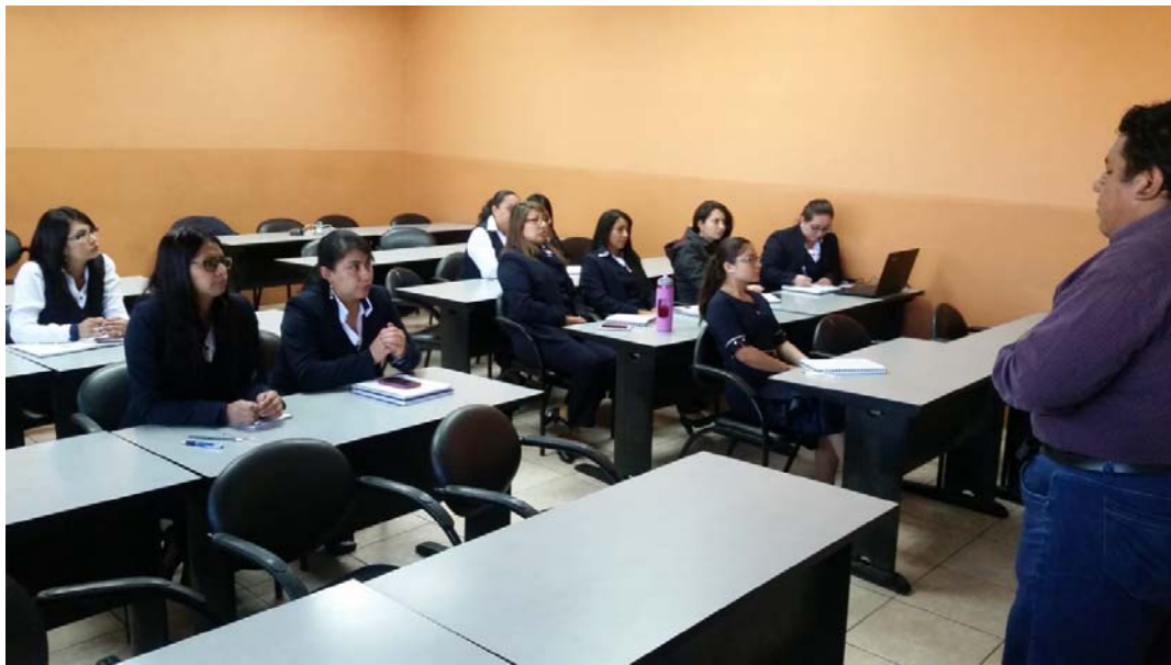
Formación de personal de la UPS sobre gestión documental