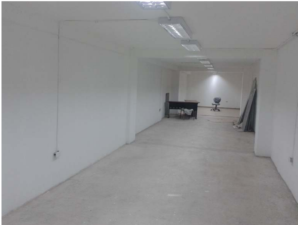
Adecuación del espacio para lo que será la zona de conservación, 2013