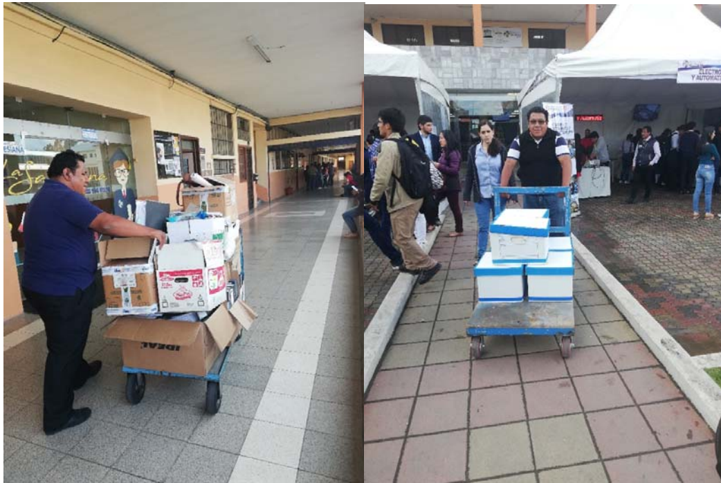
Proceso de transferencia documental