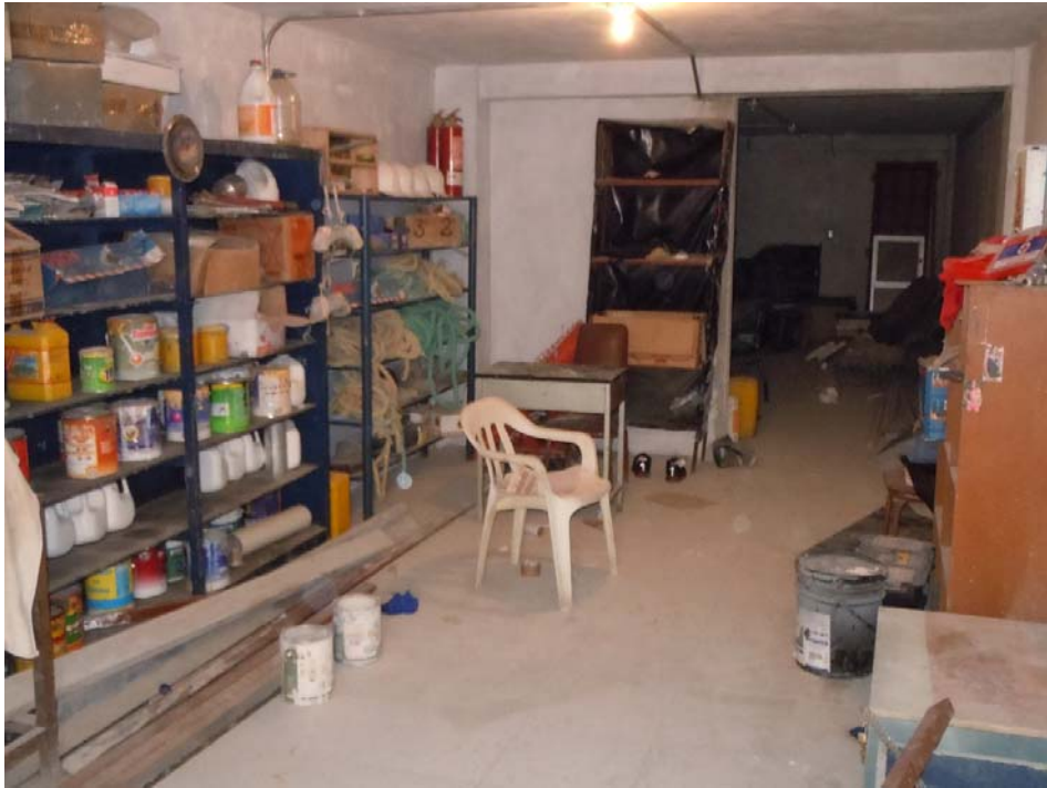
Búsqueda de espacio para la implementación del Archivo Intermedio. 2013