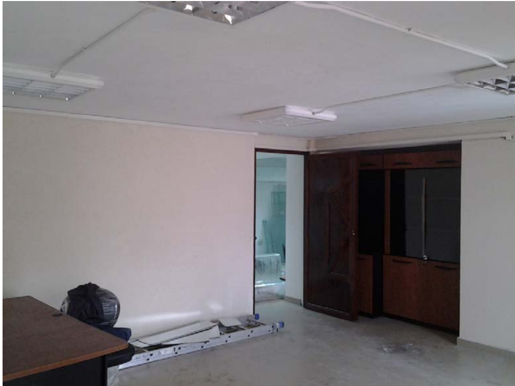
Adecuación del espacio zona administrativa, 2014