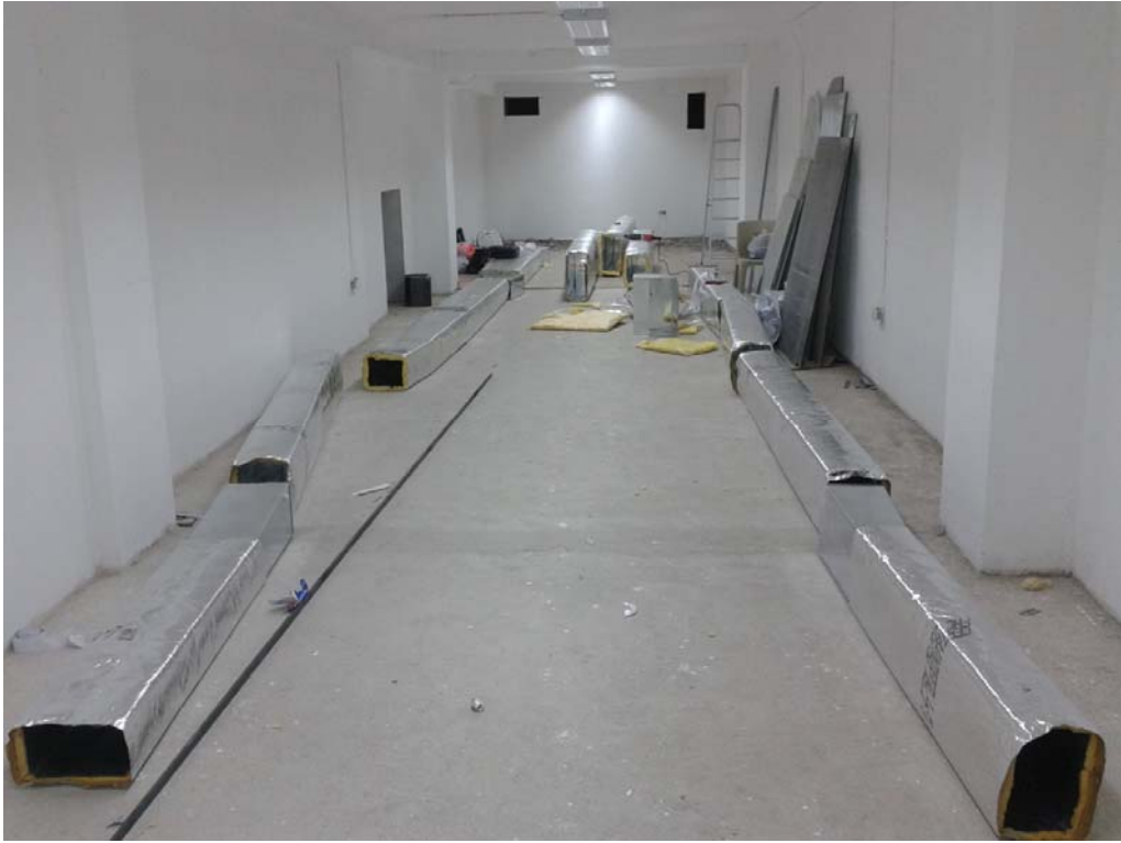
Instalación del sistema de circulación de aire, 2014