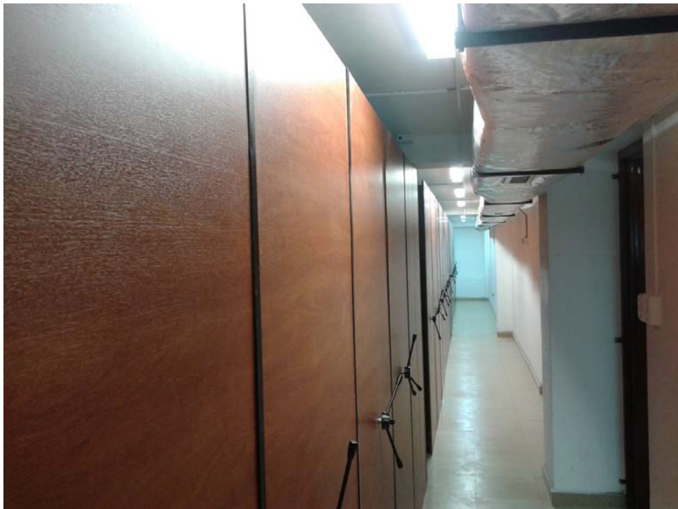
Implementación del sistema rodarchivos, 2014