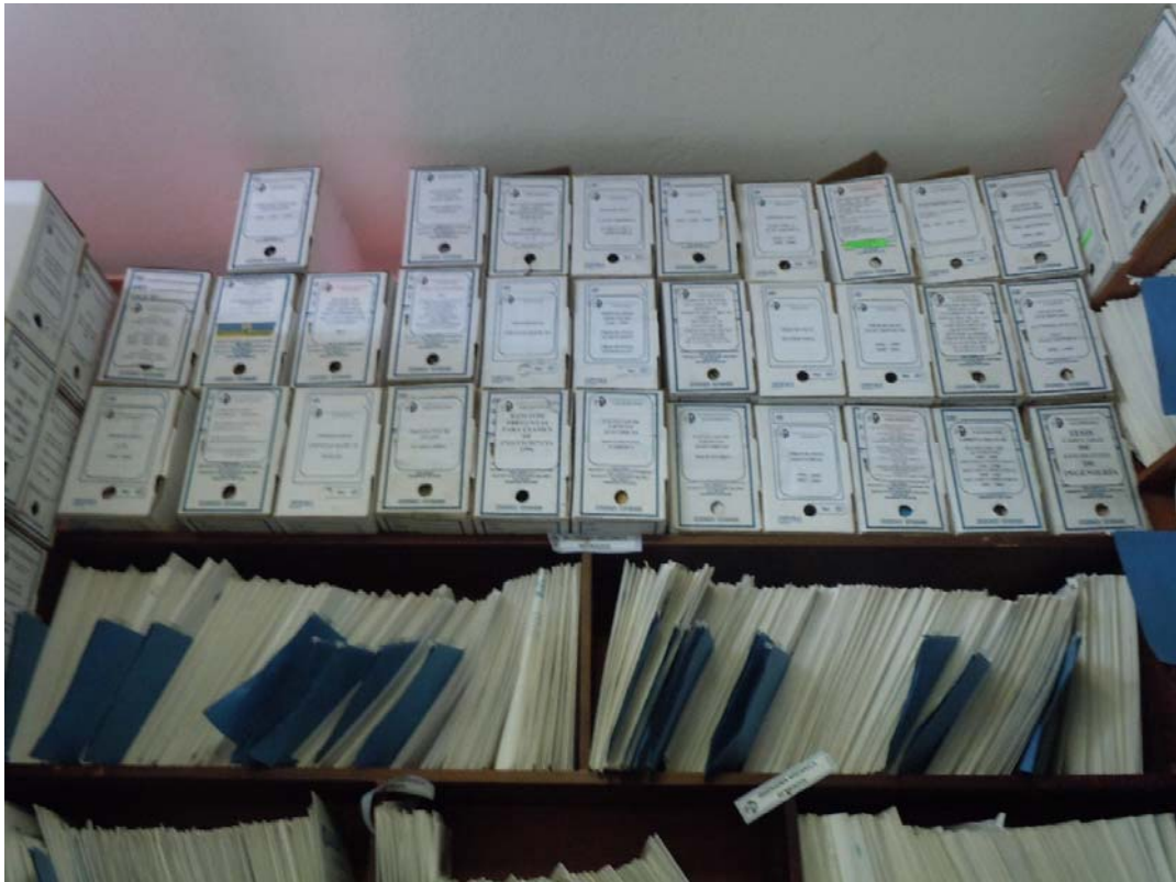
Situación del Archivo de oficina, 2013