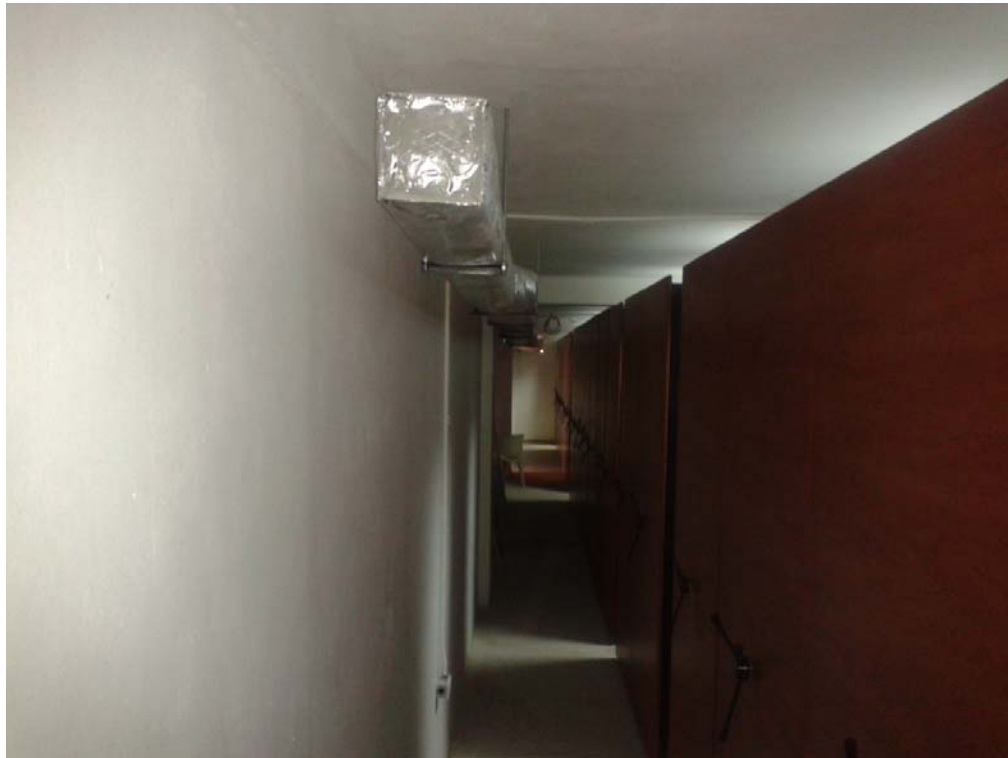
Implementación del sistema rodarchivos, 2014