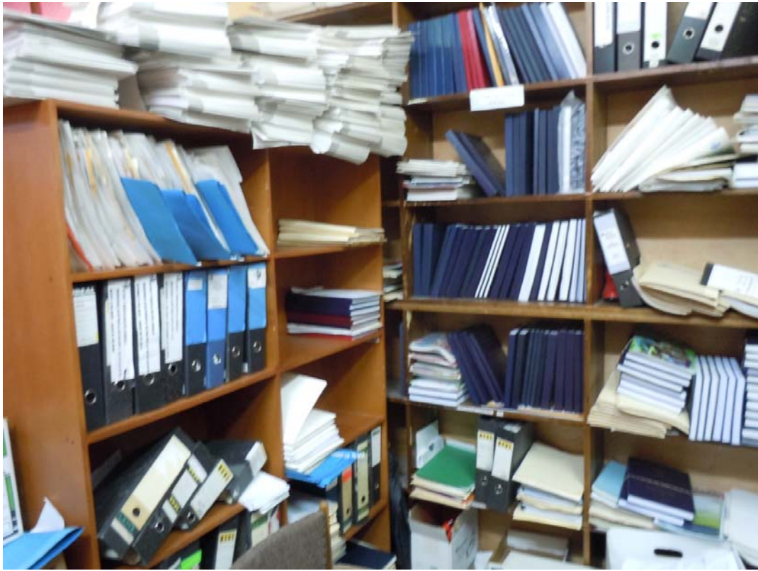
Situación del Archivo de oficina, 2013