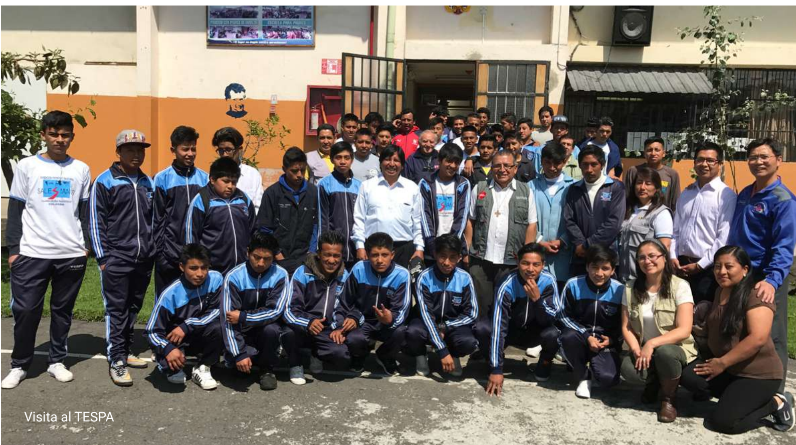
Visita al TESPA