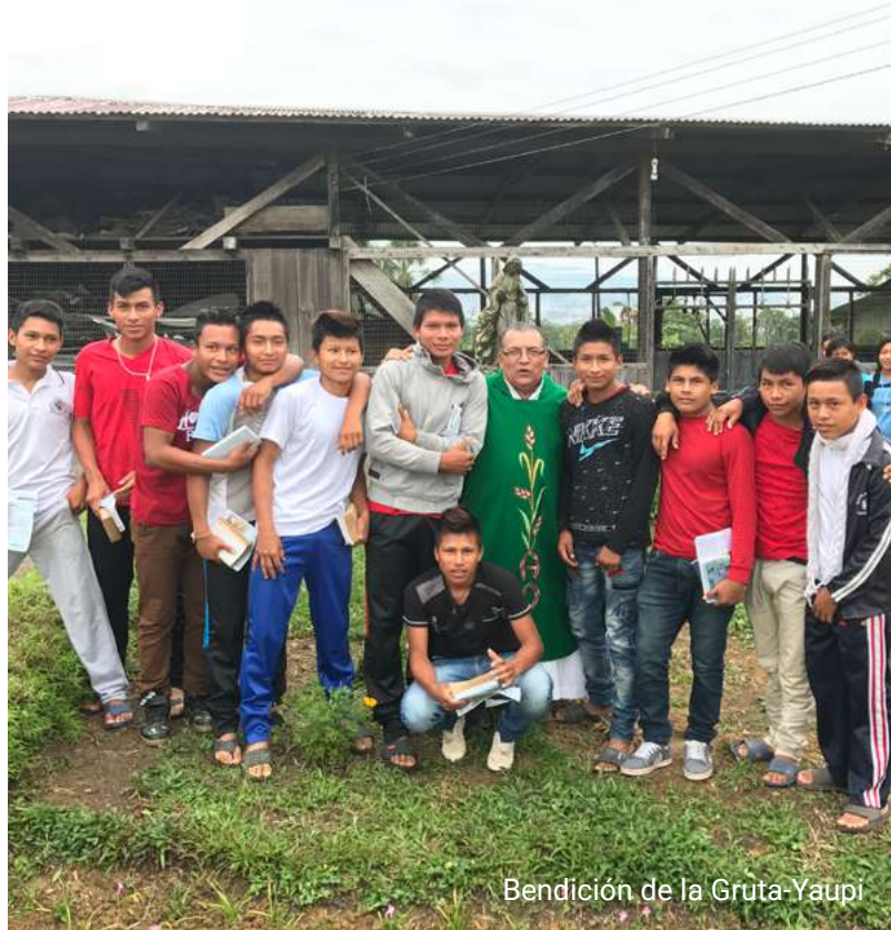
Bendición de la Gruta-Yaupi

Comenzamos el mes de noviembre, mes de evaluaciones; es bueno reconocer los logros para alegrarnos y las falencias para dejarnos retar, nuestros destinatarios requieren de nuevas respuestas, más eficaz y que respondan al querer de Dios con el corazón de Don Bosco; siempre confiando en la providencia y el saber que somos instrumentos en las manos del Buen Dios.