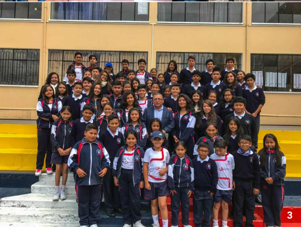
Foto 3: Alumnos de la Unidad Educativa Salesiana Sánchez y Cifuentes compartieron con el padre Inspector previo a una convivencia.

Foto 2: Consejo Estudiantil y presidentes de curso saludaron al P. Francisco Sánchez.