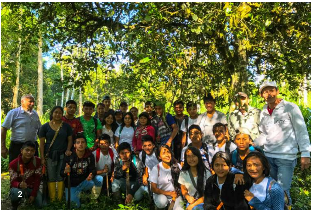
Foto 2: Estudiantes de la Unidad Educativa Fiscomisional Domingo Savio durante su labor de campo.