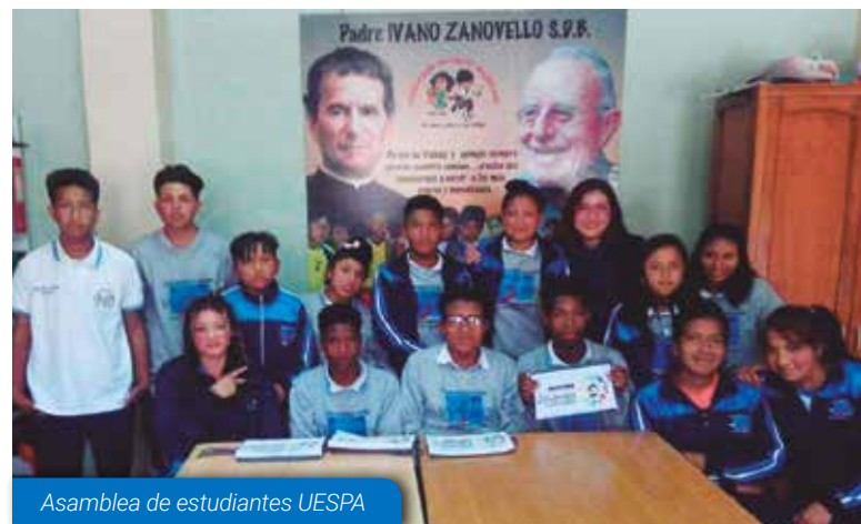
Asamblea de estudiantes UESPA