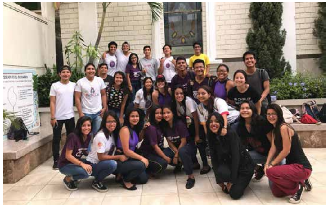
La colonia vacacional organizada por el Oratorio Ceferino Namuncurá acogió a más de 350 niños y jóvenes de distintos puntos de la ciudad de Guayaquil en medio de un lugar de sano esparcimiento oratoriano.