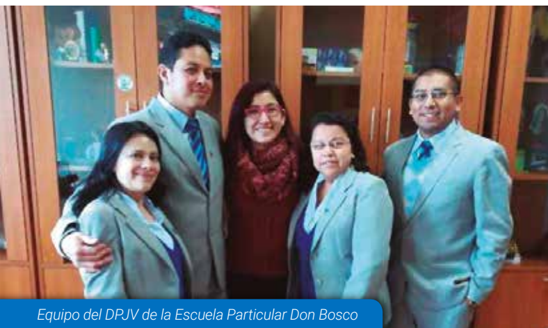
Equipo del DPJV de la Escuela Particular Don Bosco

Durante el mes de marzo se iniciaron las visitas de acompañamiento y evaluación a los DPJV, con la finalidad de orientar la gestión pastoral hacia el cumplimiento de los estándares de calidad educativo - pastoral. Las visitas se desarrollan a través de 4 procesos: