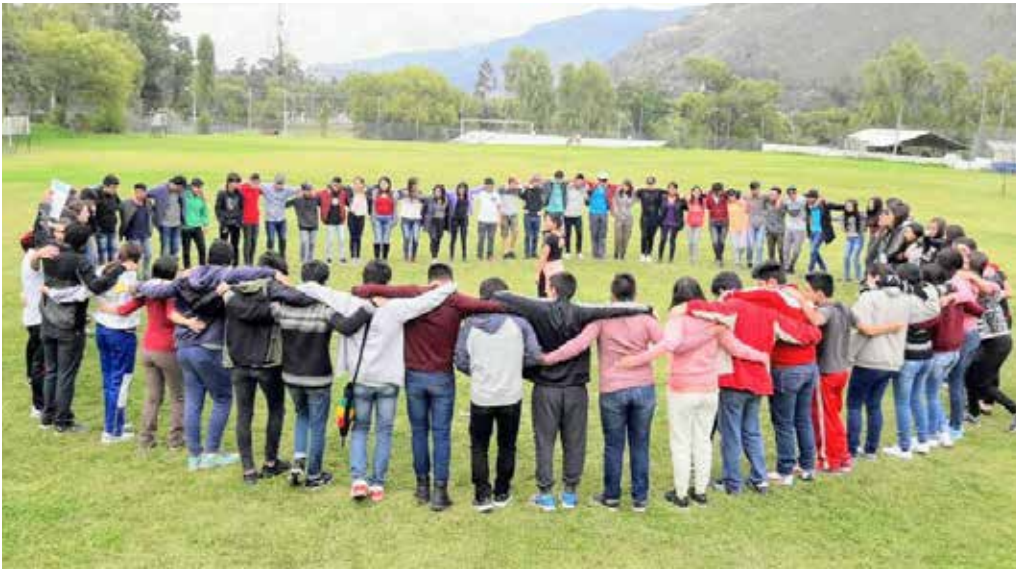
Alrededor de 105 jóvenes participaron del Campamento Juvenil -Yanuncay - misiones 2018, donde se impartieron talleres formativos sobre las actividades de animación que se van a desarrollar en Bomboiza por motivo de la Semana Santa.