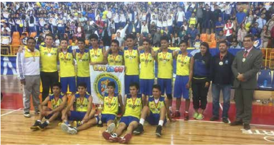
La selección de básquet de la categoría superior se coronó campeón al vencer al equipo de La Salle por 65 a 40 puntos.