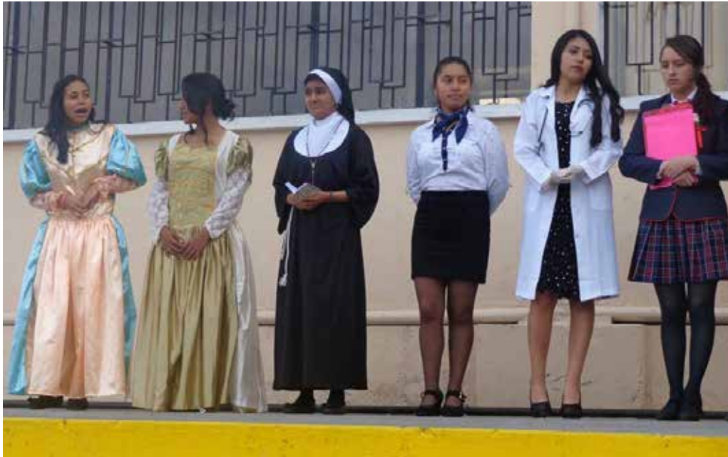
El 8 de marzo se celebró el día de la Mujer en la Unidad Educativa Fiscomisional Domingo Savio.