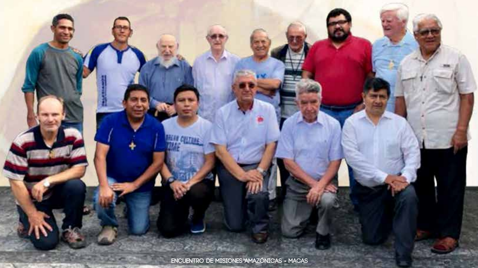
ENCUENTRO DE MISIONES AMAZÓNICAS - MACAS