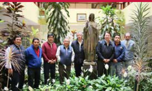
ANIMACIÓN GOBIERNO INSPECTORIAL