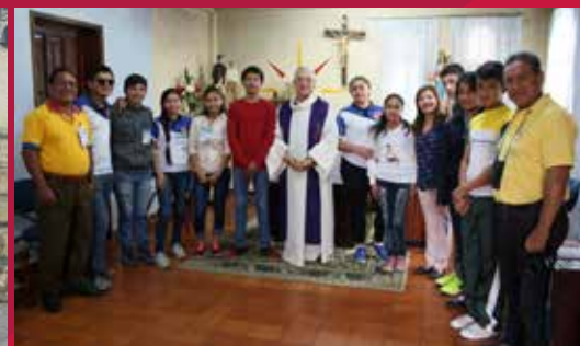
VIDA COTIDIANA SALESIANA