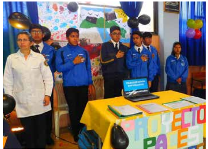
El 15 de marzo se realizó la inauguración de la Casa Abierta 2018 con la exposición de los trabajos de los estudiantes de Primero y Segundo de Bachillerato.