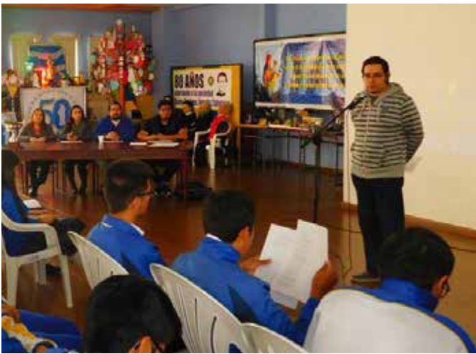
El área de Lengua y Literatura organizó el primer concurso de declamación de poesías de autores ecuatorianos con la participación de los estudiantes del Bachillerato de la UETS.