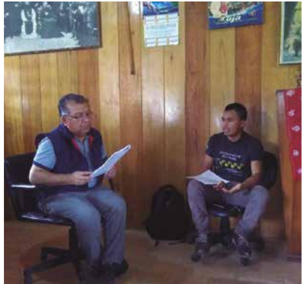
Encuentro con el representante de la asociación shuar de Bomboiza.