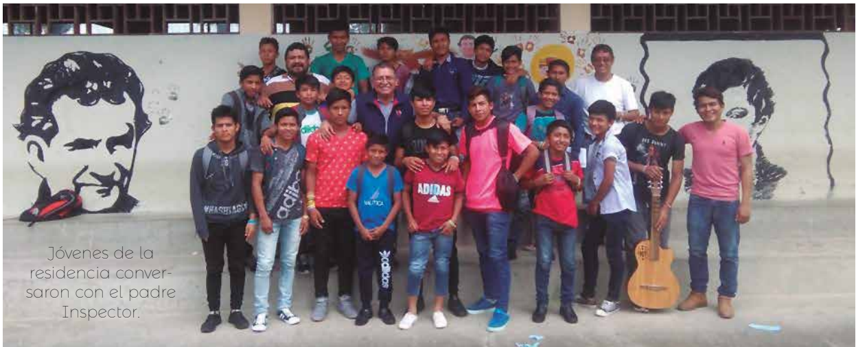
Jóvenes de la residencia conversaron con el padre Inspector.