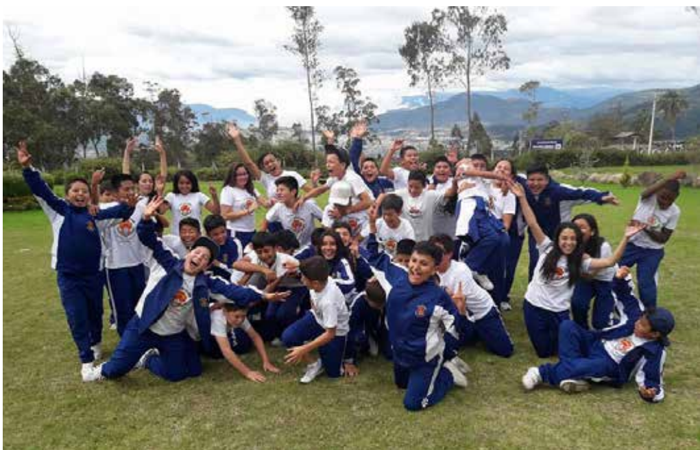
Convivencias con estudiantes del Sánchez y Cifuentes.