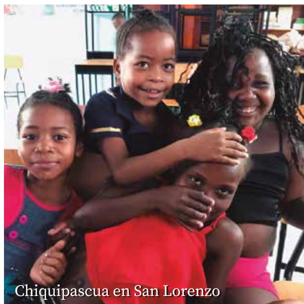
Chiquipascua en San Lorenzo