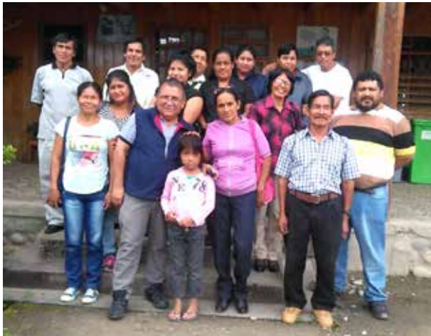
Reunión con Etserin y catequistas de la parroquia