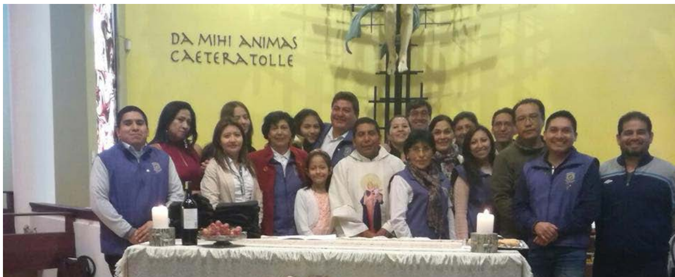
Foto noticias Salesianos Cooperadores