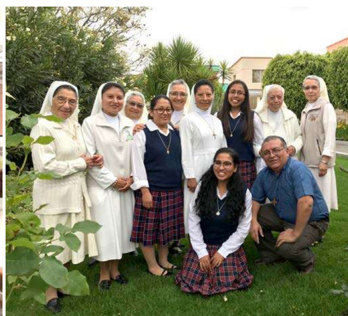
Formandas y hermanas FMA en el encuentro fraterno en la casa de espiritualidad en Cumbayá.