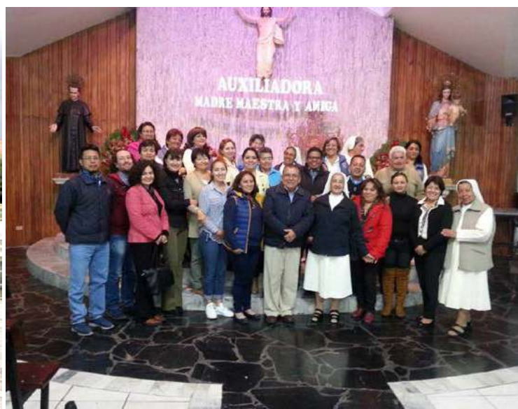
Encuentro con al Familia Salesiana de Riobamba durante la visita inspectorial.