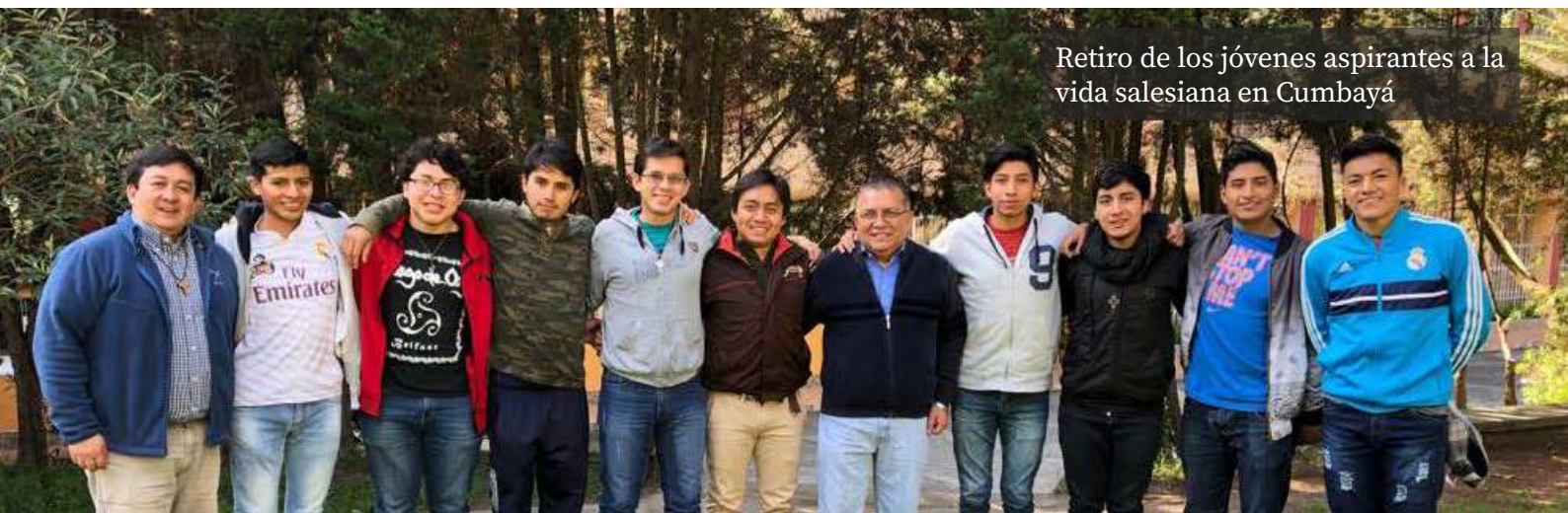
Retiro de los jóvenes aspirantes a la vida salesiana en Cumbayá

Esta reflexión sobre la realidad nos ha permitido individuar, como explica más ampliamente en la carta que nos escribe como base para la reflexión, «la urgencia de centrar nuestra mirada en la persona del salesiano que, como hombre de Dios, consagrado y apóstol, sea capaz de sintonizar plenamente con los adolescentes y jóvenes de hoy y su propio