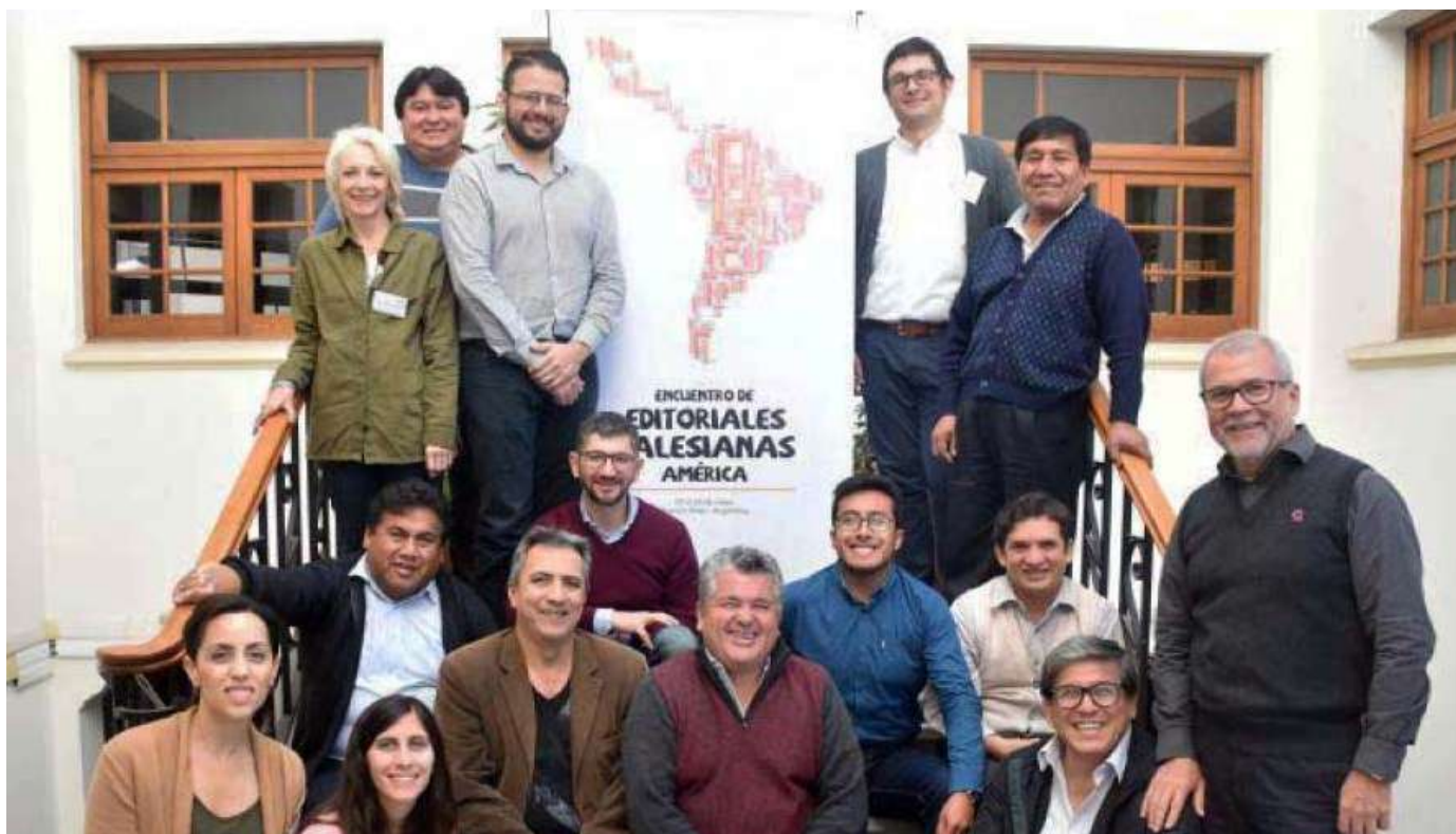
Foto noticias Encuentro Editoriales Salesiana