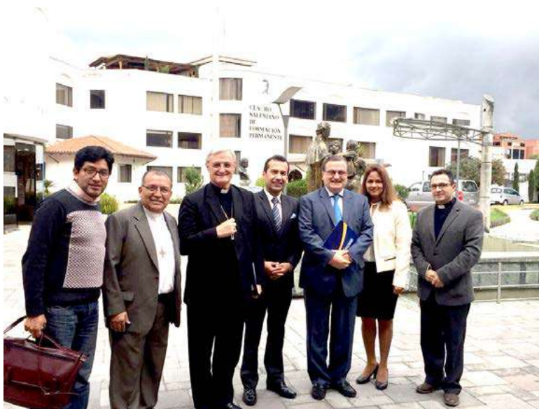
Visita del Sr. Nuncio Apostólico a la UPS con motivo de la inauguración de la carrera de Teología On-line.