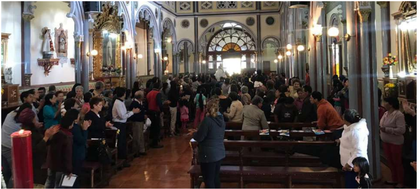
Foto noticias Parroquia Cristo Rey La Tola