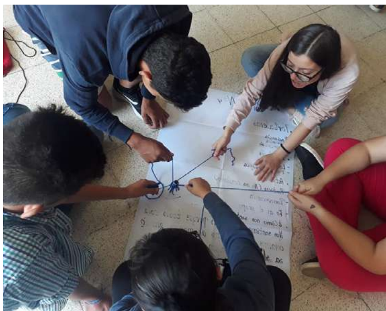
Estudiantes de segundo de Bachillerato General Unificado participaron de un retiro espiritual en la ciudad de Piñas del 20 al 22 de noviembre.