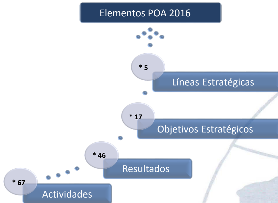
Gráfico 1. Estructuración del Plan Operativo Anual 2016.