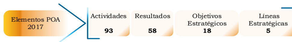
Gráfico 1. Estructura del Plan Operativo Anual 2017.