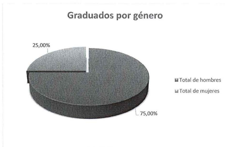
GRÁFICO No 1 RESULTADO DEL ANÁLISIS DEL LITERAL 5.1