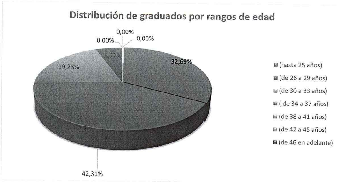
GRÁFICO No 2 RESULTADO DEL ANÁLISIS DEL LITERAL 5.2