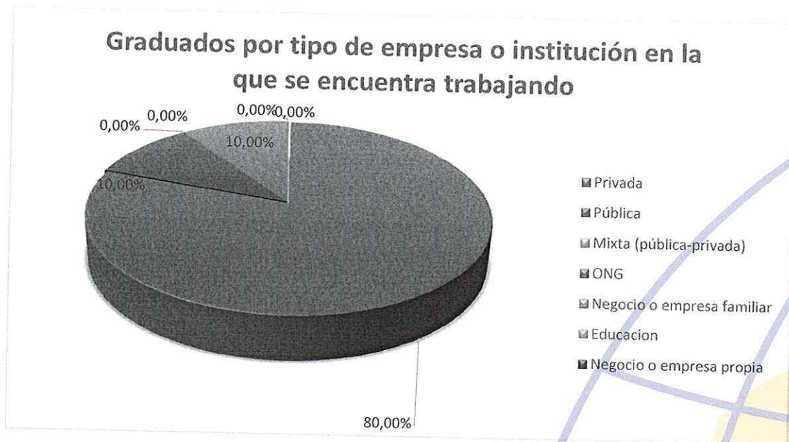
GRÁFICO No 4 RESULTADO DEL ANÁLISIS DEL LITERAL 5.4

En el periodo 49, de los graduados que respondieron encuestas y que tienen trabajo el 80% trabaja en el sector privado, cabe resaltar que no hay graduados emprendedores, lo que indica que se debe potenciar y fortalecer más el área de innovación, creatividad y emprendimiento dentro de la carrera.