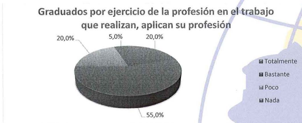
GRÁFICO No 7 RESULTADO DEL ANÁLISIS DEL LITERAL 5.7

Para el periodo 49, de los graduados que respondieron encuestas y que trabajan el 75% aplican su profesión para el cual se prepararon.