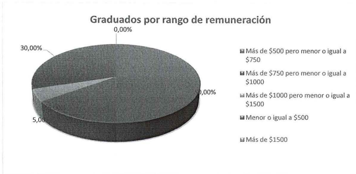
GRÁFICO No 10 RESULTADO DEL ANÁLISIS DEL LITERAL 5.10