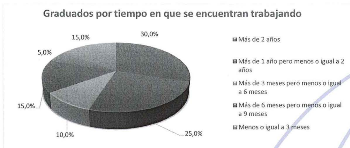
GRÁFICO No 8 RESULTADO DEL ANÁLISIS DEL LITERAL 5.8

Para el periodo 49, de los graduados que respondieron encuestas y que trabajan se puede verificar que hay un 25% que están trabajando entre [1 ; 2] años; hay un 30 % que trabajan más de 2 años. De los datos se desprende que hay un 55% de graduados se han estabilizado en sus trabajo.