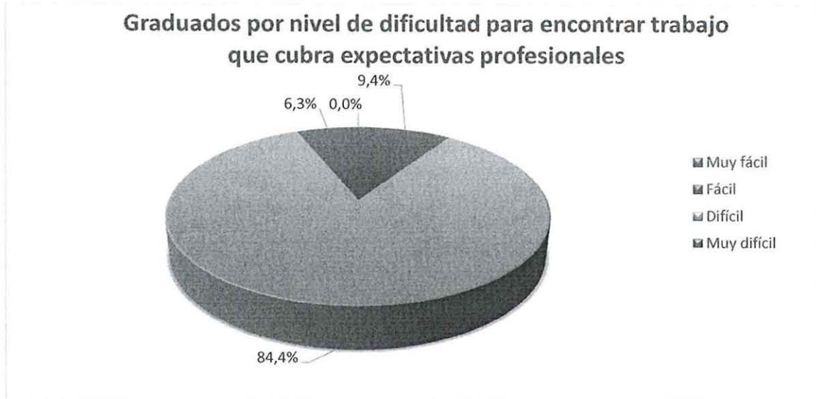
GRÁFICO No 16 RESULTADO DEL ANÁLISIS DEL LITERAL 5.16