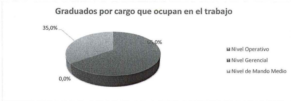
GRÁFICO No 6 RESULTADO DEL ANÁLISIS DEL LITERAL 5.6