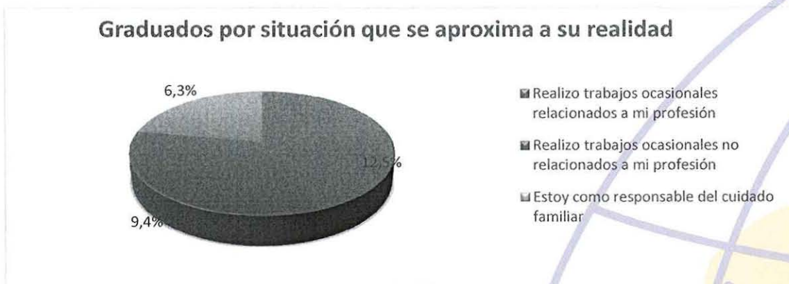
GRÁFICO No 14 RESULTADO DEL ANÁLISIS DEL LITERAL 5.14

De los graduados que respondieron encuestas y que no tienen trabajo el 71,9% indica que realizan trabajos ocasionales relacionados a su profesión, el 12,5% indican que realizan trabajos ocasionales no relacionados a su profesión, el 9,4% indica que están de responsables del cuidado familiar y un 6,3% indican que realizan otra actividad.