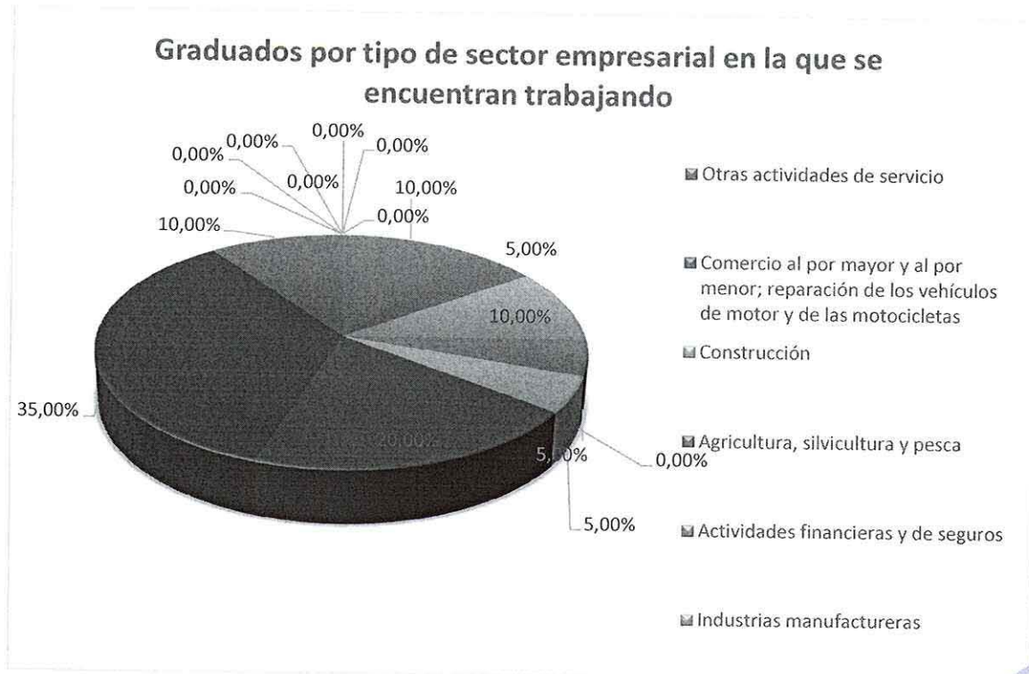
GRÁFICO No 5 RESULTADO DEL ANÁLISIS DEL LITERAL 5.5