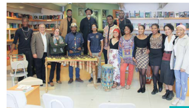
La librería Abya Yala (12 de Octubre y Wilson, Quito), con ocasión de lanzamientos de libros, se ha convertido en un activo centro de actividades culturales.