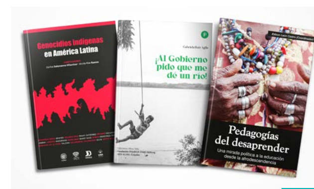
Los pueblos indígenas, el medioambiente y los pueblos afroamericanos constituyen el centro de la producción editorial de Abya Yala.